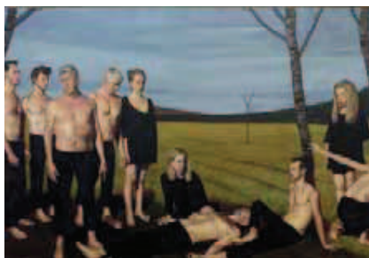
François Malingrèy, La Grande scène, ils sont tous venus, 2015, toile, 200 x 300 cm.

TH : Pour une exposition, l'important c'est l'artiste et son œuvre. L'important pour un galeriste, c'est à 90% le fichier des acheteurs potentiels. Celui-ci se développe dans les foires, pas avec les chalands qui passent.